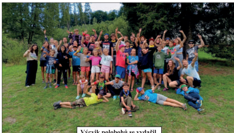
Výcvik polobohů se vydařil.