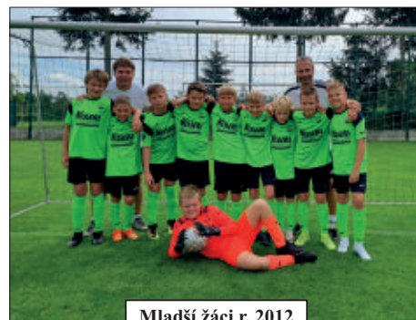
Mladší žáci r. 2012