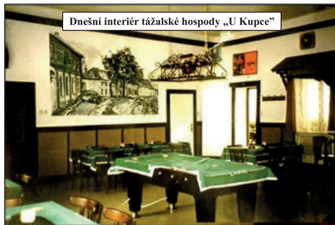
Dnešní interiér tážalské hospody „U Kupce“