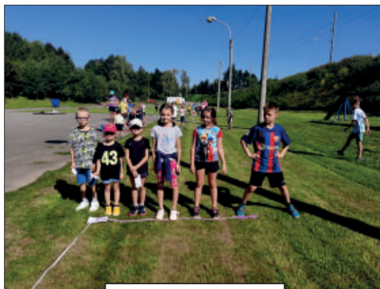
Atletický víceboj za tratí