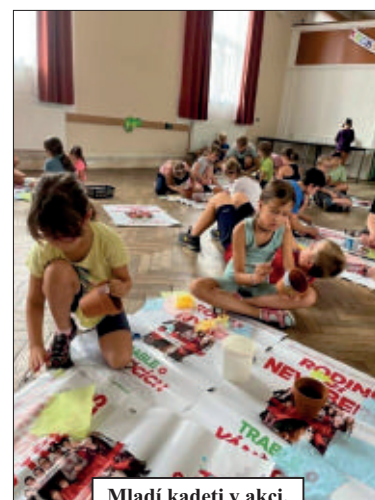
Mladí kadeti v akci.

S nadšením očekáváme další ročníky sponkovských akcí a těšíme se na všechny děti, které s námi budou prožívat nová dobrodružství. Doufáme, že se nám podaří připravit pro ně stejně poutavý a zábavný program, jako tomu bylo doteď. Děkujeme obci za podporu, všem, kteří se na přípravě a organizaci podílejí a těšíme se na další spolupráce.