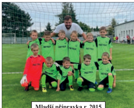
Mladší přípravka r. 2015

Do podzimní části soutěže fotbalových přípravek jsme naskočili s dvěma podstatnými změnami. Jelikož se nám fotbalová základna neustále rozrůstá, rozhodli jsme se přihlásit do soutěže také náš nejmenší potěr: ročníky 2015 a mladší. Někteří fotbaloví nadšenci v této skupině přešli z pohybové školičky, jiní naopak skočili do kožušanských kopaček rovnou bez předchozí znalosti místního prostředí.